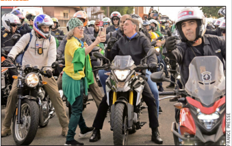
BOLSONARO visitó Juiz de Fora, a tres meses de la elección presidencial.